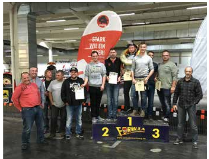
Siegerehrung beim Kartevent der Niederlassung Nürnberg mit Prefa und rennbegeisterten Kunden

Wir danken allen Beteiligten (Rennfahrern) für die heißen Reifen und den vollen Einsatz – es hat Spaß gemacht! Vielen Dank unserem Industriepartner Prefa für den gelungenen Abend. Wir freuen uns auf das nächste Jahr, wenn es wieder heißt: Start frei.